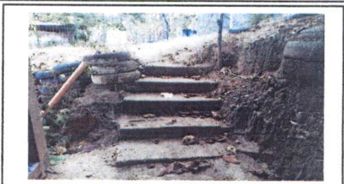
Foto 2: Área de banqueta de baja de gradas para los baños en malas condiciones, mejoraría para poder facilitar el acceso de los estudiantes.