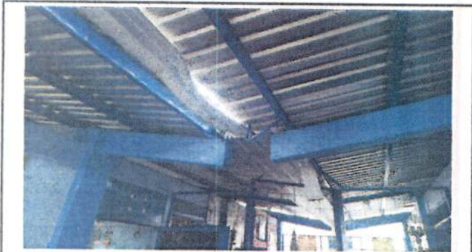
Foto 3: Estructura de canal de metal en mal estado, quebrado y roto.