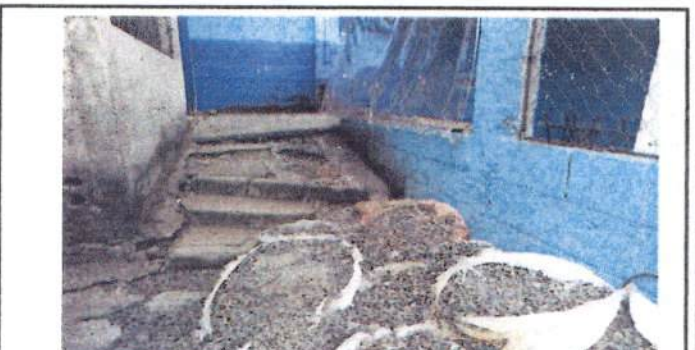
Foto 6: Área de cocina, se debe mejorar el acceso a la misma y un entortado de cemento dentro de la misma.

Observación: Si es necesario se pueden agregar hojas adicionales y actualizar el número de hojas.