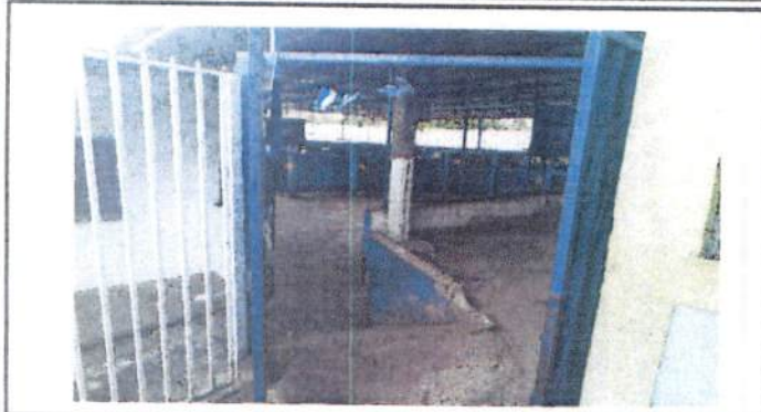
Foto 1: Area de entrada se debe mejorar las paredes y torta de cemento para evitar cualquier accidente en la bajada de los estudiantes.