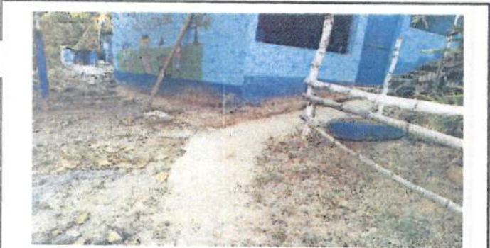
Foto 5: Construcción y mejoramiento de torata de concreto en banquetas y cunetas para acceso al centro educativo.